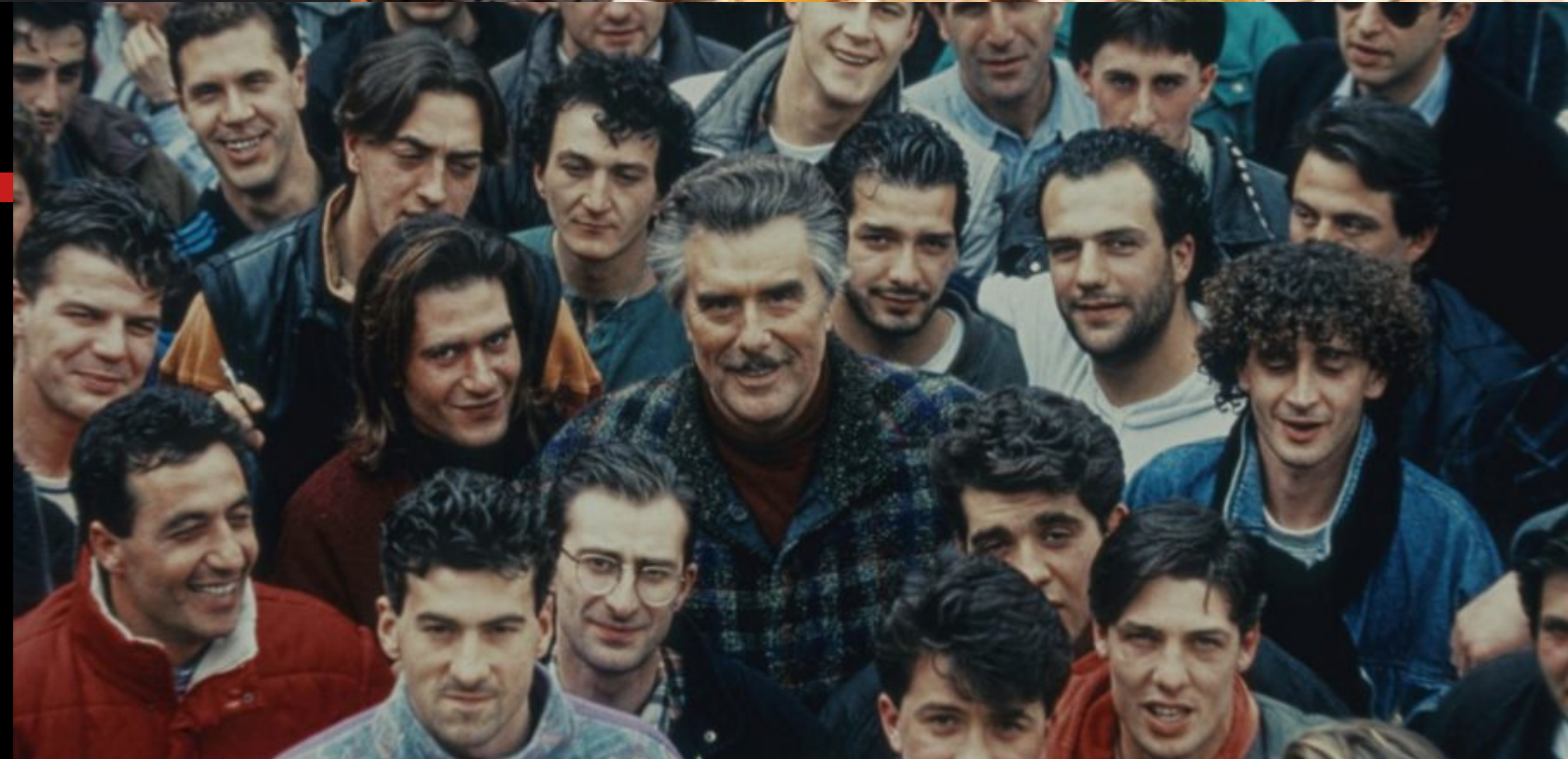
SanPa Luci e tenebre di San Patrignano (2020 - Gianluca Neri)