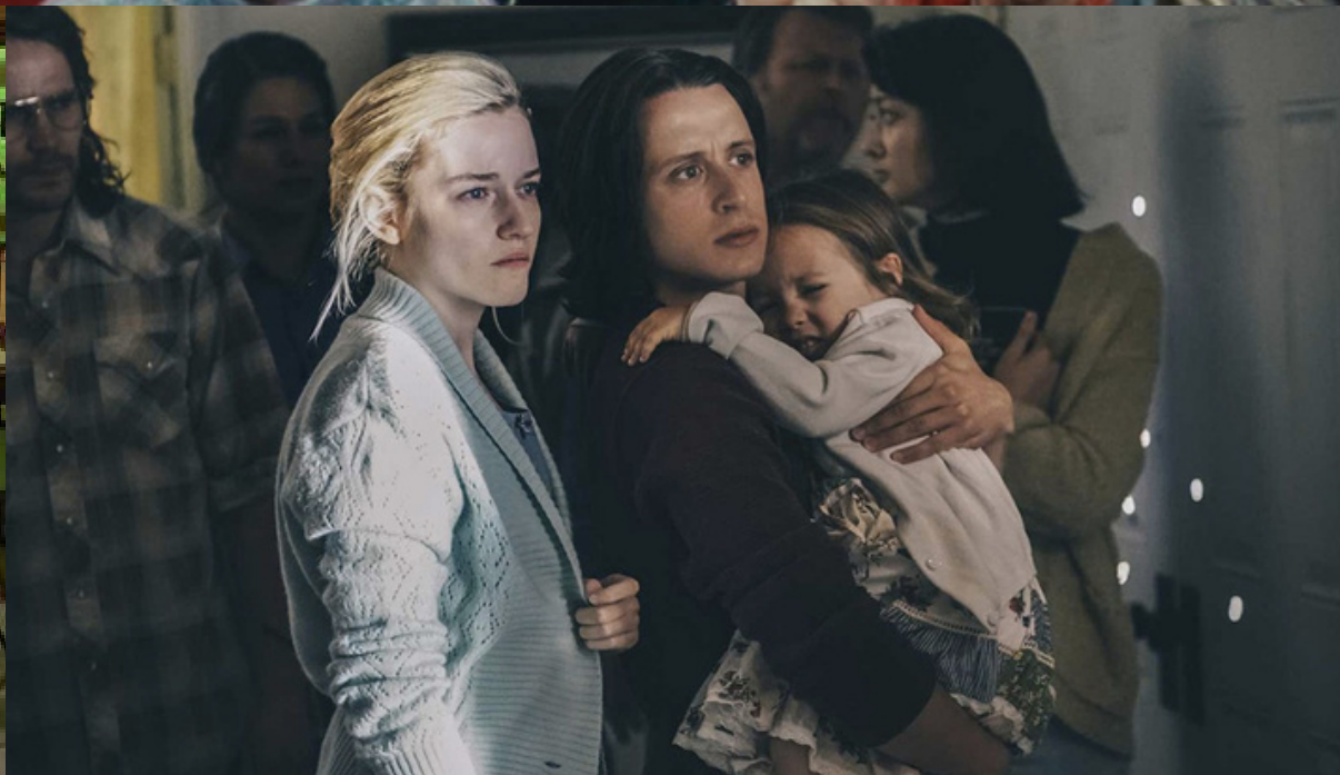
Waco (2018 - John Erick Dowdle, Drew Dowdle)