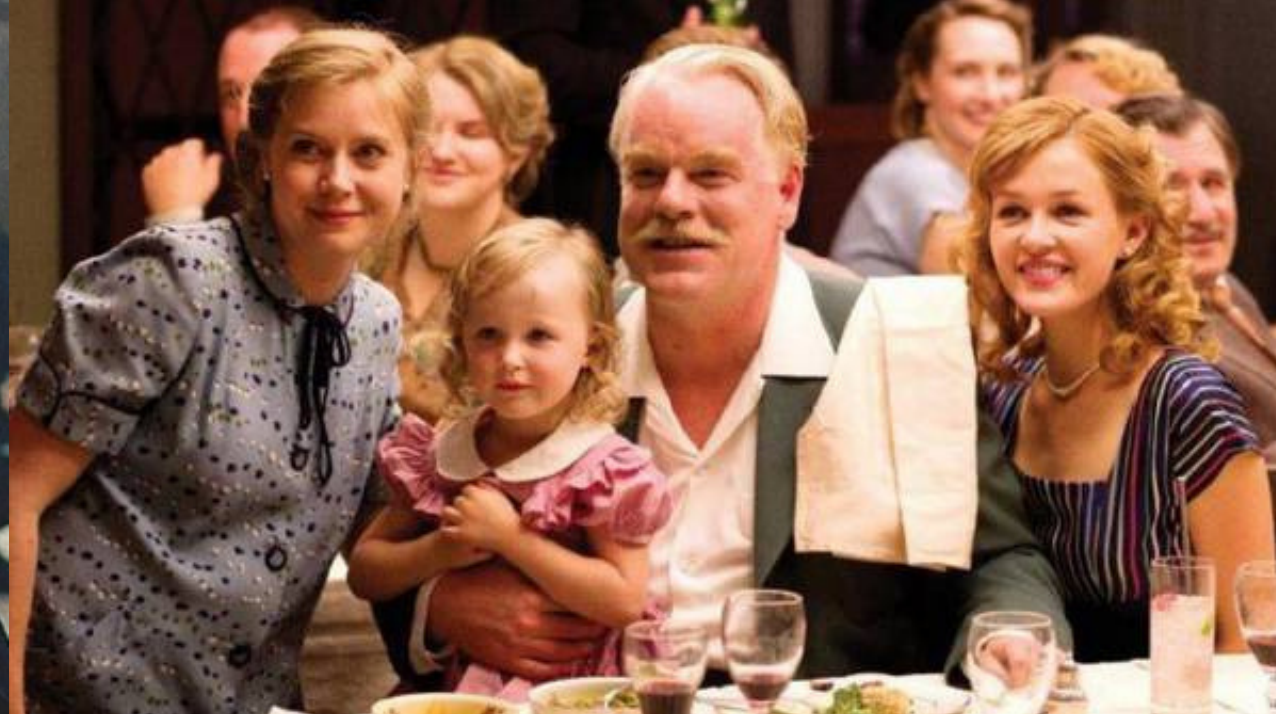
The Master (2012 - Paul Thomas Anderson)